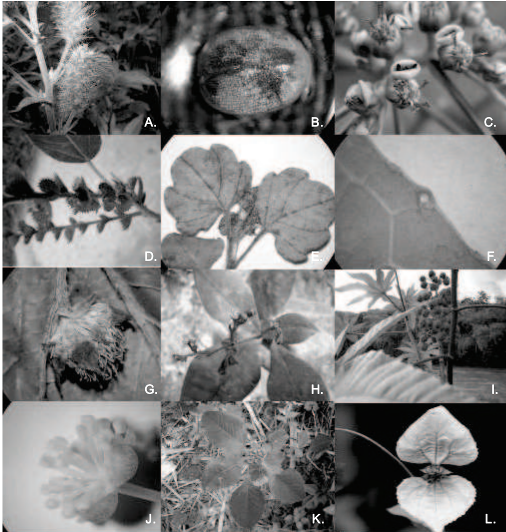
Leyenda fotografías del anexo 2: A. Inflorescencia femenina de Acalypha arvensis , B. Detalle de la semilla de Croton hirtus , C. Ciatos de Euphorbia pulcherrima , D. Detalle de la inflorescencia femenina de Acalypha macrostachya , E. Hoja crenadas de Dysopsis paucidentata , F. Glándula marginal de Mabea klugii , G. Flor femenina de Caperonia palustris , H. Dicaciatia de Euphorbia goudotii , I. Infrutescencia de Ricinus communis , J. Flor masculina de Codiaeum variegatum , K. Vista superior de Euphorbia heterophylla , L. Sinflorescencia de Dalechampia dioscoreifolia .